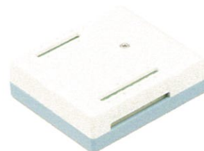
7ch温度/電圧測定ユニット WM2000TB