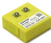
温度測定ユニット WM1000