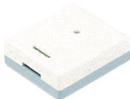
2ch温度/電圧測定ユニット WM2000TA